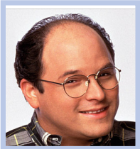
by Art Vandelay Vice President

Lorem ipsum dolor sit amet, consectetur adipiscing elit, sed do eiusmod tempor incididunt ut labore et dolore magna aliqua. Ut enim ad minim veniam, quis nostrud exercitation ullamco laboris nisi ut aliquip ex ea commodo consequat. Duis